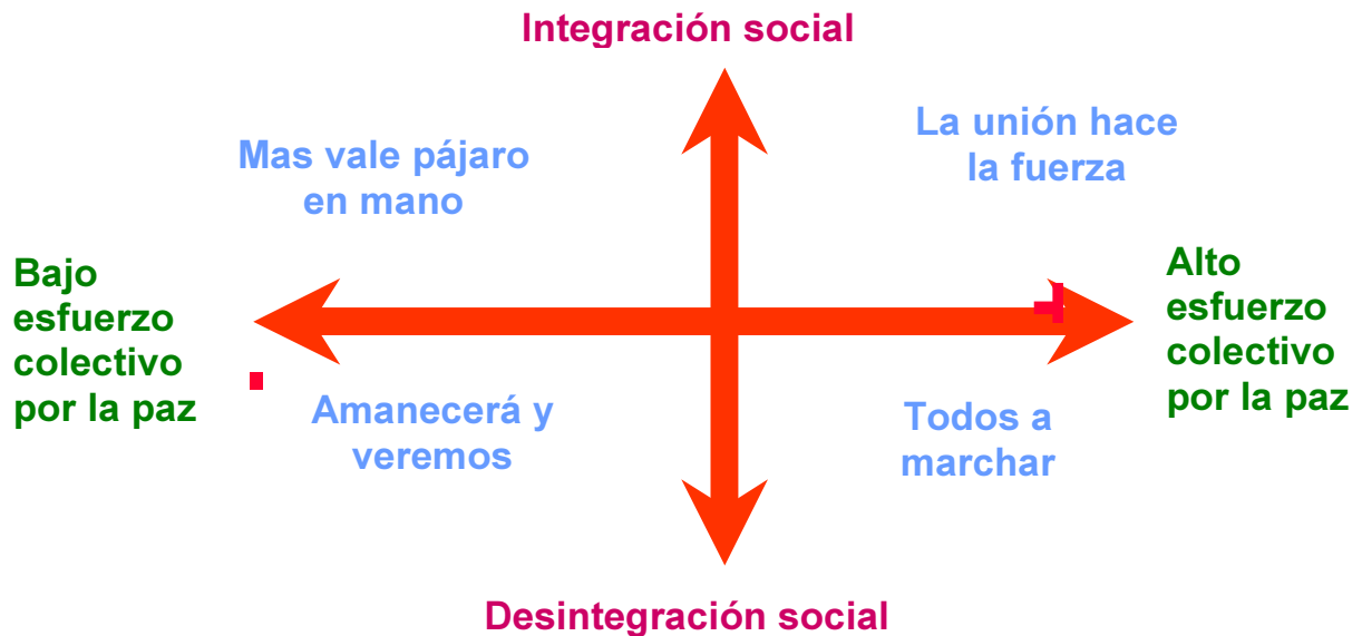
GRÁFICO 1: Escenarios posibles para el país al 2013. Proyecto Destino Colombia, Gráfica en versión del autor

como seres autónomos, interdependientes, responsables y socialmente comprometidos que deben crear, generar y aportar mucho más de lo que esperan recibir, conscientes de que la justicia, la equidad y el desarrollo se construyen desde su propio fractal y que la proyección desde éste hasta el todo se traducirá en una sociedad mejor.